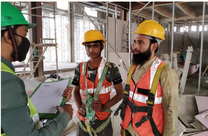
Helper (Mechanical / Electrical / Civil)